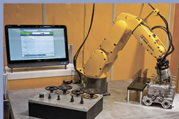
Автоматизація та роботизовані комплекси