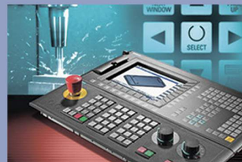
Комп'ютерні системи програмування обладнання та підготовки виробництва